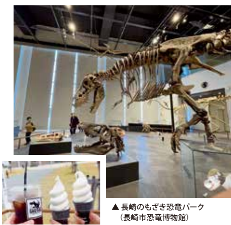
▲長崎のもぞぎ恐竜パーク (長崎市恐竜博物館)