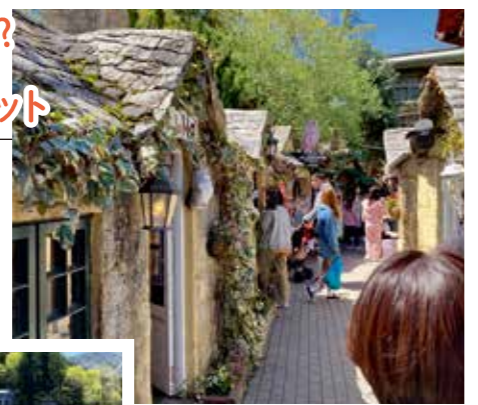
▲由布院湯の坪街道

延々とお店が立ち並ぶ湯の坪街道!グルメやお土産だけでなく、よく見るとなんじゃこりゃなお店がそこら中にあります。そして行き着く先には巨大な池!何かと詰め込み過ぎのカオス空間をその身で体感してください!